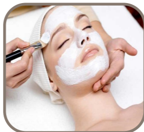
Soins du Visage

Ce soin comprend un masque hydratant, apaisant & détoxifiant suivi d'un lotion & d'une crème de jour Adapté à tous types de peau